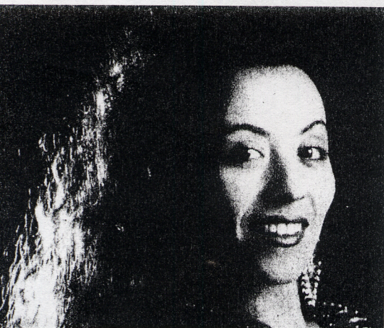
Zangeres Timna Brauer