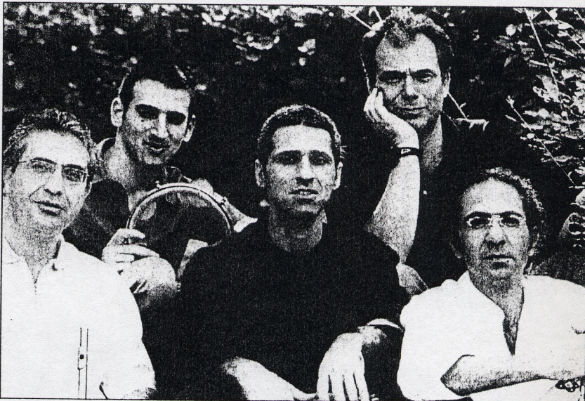
Het Ensemble Shesh Besh