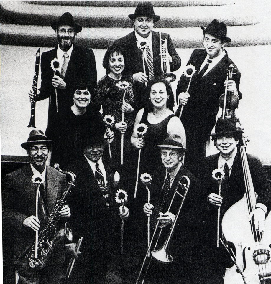
Maxwell Street Klezmer Band

Eine Übersicht über das Gesamtprogramm finden Sie auf der Rückseite dieses Heftes. Karten ab 8. Oktober bei München Ticket (089-54 81 81 81) und allen Vorverkaufstellen.