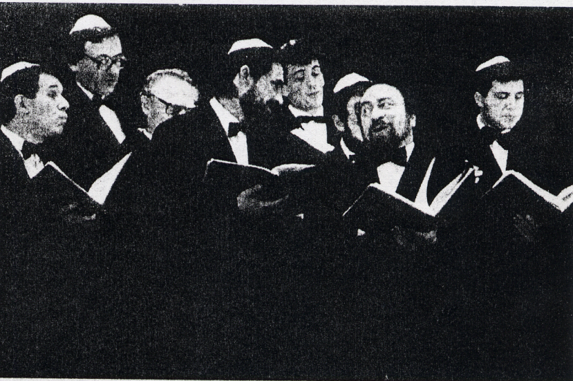
Moskou Synagogaal Koor - Chassidic Capella